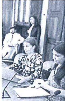
El primer congreso...